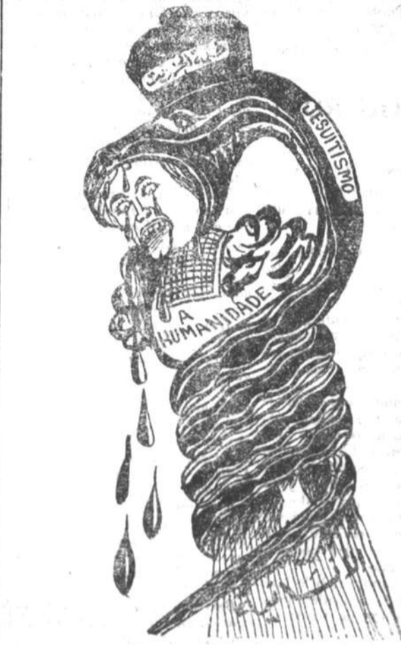
(De "A Aurora", jornal syrio de propaganda, de Campos).

Com dinheiro podem effectivamente assalariar-se mercenários famintos e propalar-se balelas passmosas, que diffundam em certos corações a alegria e a esperança, em outros a desorientação e a incerteza, nos estranhos a creança numa grave intranquillidade existante. Mas os mercenários, sem fé, debandam nos primeiros tiros; e as balelas dissipam-se ás primeiras noticias certas. Fica apenas uma impressão vaga e indecisa no espirito do estrangeiro, que, em regra, desconhece inteiramente este pais e lhe ignora de todo a situação interna, e na alma rudimentar do analfabeto